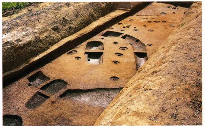
くにきゅう 【恭仁宮跡】 相楽郡加茂町例幣

奈良県と界する平城山丘陵の北側の裾に広がる縄文時代～室町時代にかけての複合遺跡です。最盛期は、土器棺2基や方形周溝墓にみる墓域として利用した弥生時代中期、方形竪穴式住居や掘立柱建物を建てて居住空間とした古墳時代中～後期のようなようです。