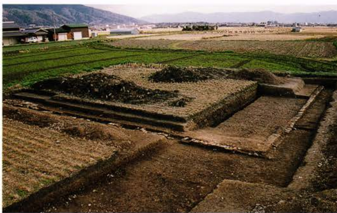
いけじり 【池尻廢寺跡】 亀岡市馬路町