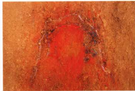
頭飾り出土状況(パネル展示)