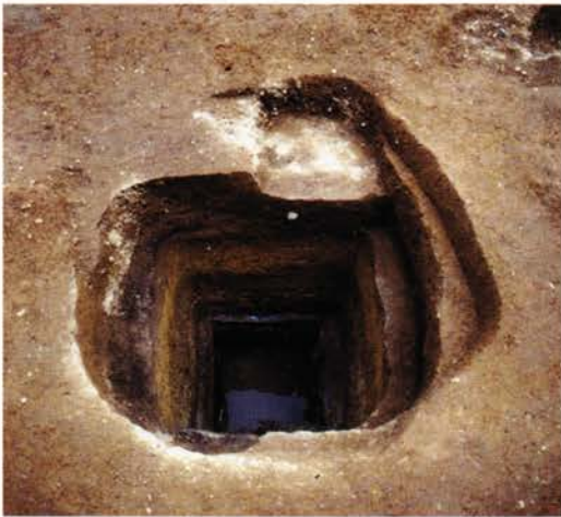
ながおきょう いのうち 【長岡京跡右京・井ノ内遺跡】 長岡京市井ノ内 (財)長岡京市埋蔵文化財センター調査

長岡京右京の光明寺の東方の調査では、1/2もしくは1/4町規模の宅地内から長岡京期の立派な井戸が見つかりました。最下層からは、当時の土器や木器がたくさん出土しました。木製品には、3寸毎に刻みを入れた8寸の物差しや人面を彫刻した陽物形木製品もあります。平安時代前期にはごみ穴として再利用され、緑釉唾壺や印刻文で飾る大形の鉢が捨てられました。