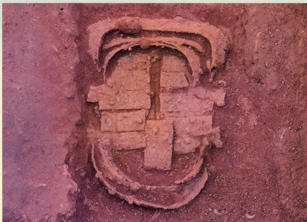
園部町今林6号墳出土短甲