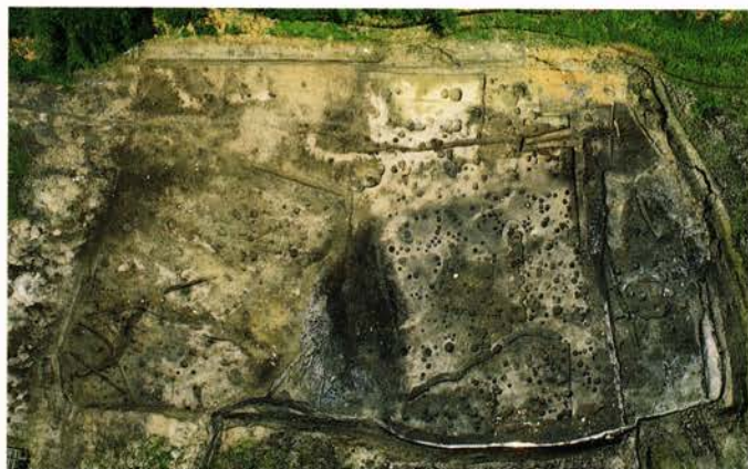
おきた 【沖田遺跡】 中郡大宮町森本 (財)京都府埋蔵文化財調査研究センター調査

竹野川の上流、左岸の丘陵裾付近に所在する縄文時代～室町時代の集落遺跡です。古墳時代後期の竪穴式住居跡や各時代に掘削された溝などの遺構とともに多量の遺物が出土しました。その中でも鎌倉時代～室町時代の男性人形、刀子や船の形代などの多彩な木製品と、動物を墨書した土師器皿は特筆すべきものです。