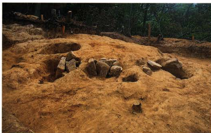
ひよしがおか 【日吉ヶ丘遺跡】 与謝郡加悦町明石 加悦町教育委員会調査

平安時代中期頃から始まる仏教経典を埋納する風習が全国に広がるなか、丹後地方もその例に漏れることなく、各地に経塚が営まれました。エノク経塚では、丹波・丹後地方に普遍的なL字形埋納坑を伴うものが5基検出されました。東播磨系の中世須恵器甕や、鎌倉時代の越前焼三耳壺などの外容器が出土しています。副葬品には洲浜草鳥鏡があります。