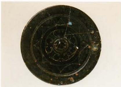
長宜子孫銘内行花文鏡