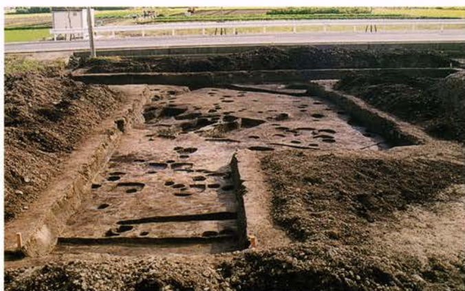
おおた 【太田遺跡】 亀岡市穉田野町

行者山から緩やかに東へ延びる丘陵に挟まれた台地上に位置しています。縄文時代～鎌倉時代にいたる集落跡で、官寺的様相の強い桑寺廢寺や、推定丹波国府跡をも含む大複合遺跡です。弥生時代中期の竪穴式住居跡・方形周溝墓や奈良時代の溝などが、多様な弥生土器や磨製石器類・須恵器とともに見つかっています。