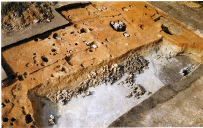
たきぎ 【薪遺跡】 京田辺市薪