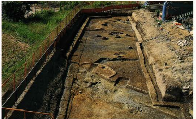
しもうえのみなみ 【下植野南遺跡】 乙訓郡大山崎町円明寺 (財)京都府埋蔵文化財調査研究センター調査

天王山の東山麓を縦断する西国街道をまたいで広がる奈良時代～平安時代を中心とした遺跡です。近辺には山崎津や山城国府があり、大変重要な交通の要衝地でもあります。今回の調査では、古墳時代の溝、平安時代の落ち込みや掘立柱建物跡などが土器・陶磁器を伴って検出されました。中国越州窯青磁碗は注目されます。