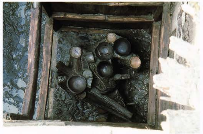
おんなだに・あらかさか 【女谷・荒坂横穴群】 八幡市美濃山字御毛通

山崎院は天平3(731)年に僧行基によって建立されました。平成11年の調査で、9世紀前半に焼け落ちたとみられる、瓦類や塑像・壁体片が焦土に混じって多数出土しました。壁体片には彩色を施したものがあり、自然科学による分析結果をもとに唐草文を描いた彩色壁画が復原されました。