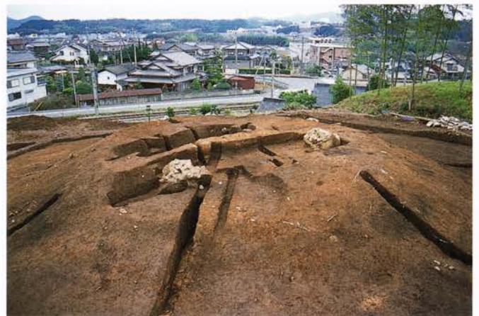
かんのんじ 【観音寺遺跡】 福知山市観音寺

弘法川の右岸丘陵上に立地する36基からなる古墳群のうち、22・28号墳の調査が行われました。いずれもやや大きな円墳で、3～4mの長さの組合式木棺が直葬されています。棺内外から武器・工具・馬具などの鉄器類や須恵器が多数出土しており、6世紀後半に築造されたものとみられます。