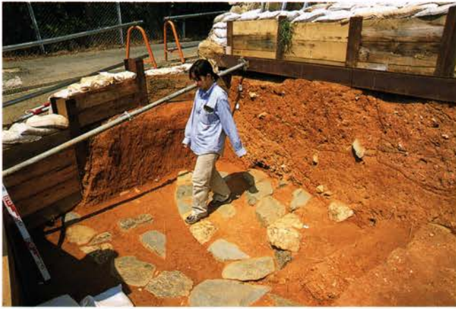
ほうぞうじなるたきけんざん 【法蔵寺鳴滝乾山窯跡】 京都市右京区鳴滝泉谷町 法蔵寺鳴滝乾山窯址調査団調査

初期の京焼を代表する尾形深省(乾山)が元禄12(1699)年から13年間操業していた窯場の推定地を平成12年から調査しました。その結果、窯本体は見つからなかったものの、窯壁片や乾山焼未成品・窯道具などが製品(陶片・磁器片・素焼片)に混じって出土し、その所在がほぼ確実になりました。