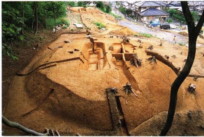
みずうちひがし 【水内東古墳】 福知山市堀水内