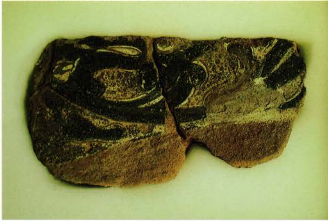
こうづや 【上津屋遺跡】 八幡市上津屋