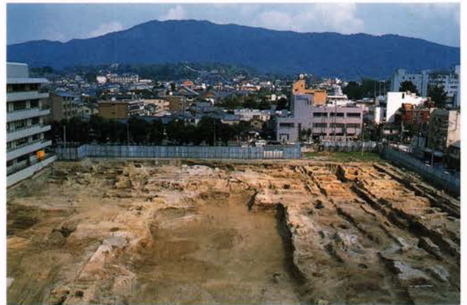
ほうはだいいん 【宝菩提院廃寺】 向日市寺戸町西垣内 (財)向日市埋蔵文化財センター調査

京大病院の南半は、聖護院村の北辺にあたり、江戸時代には、多数の文人が居を構えたことが知られています。歌人大田垣蓮月は、「蓮月焼」をこの地で焼いており、酷似した良齊銘の焼物が多数出土しました。また、乾山銘の陶磁器片とともに陶磁器生産に関わる資料が出土し、付近に二代乾山の工房の存在が指摘されています。