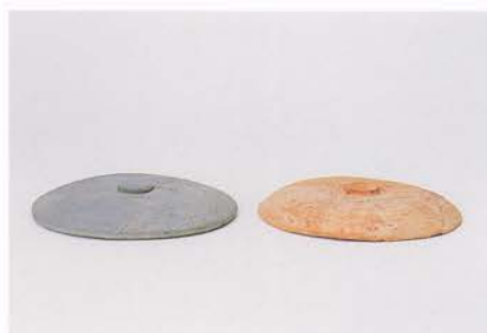
須恵器蓋・土師器蓋