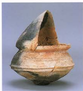
弥生土器手焙形土器