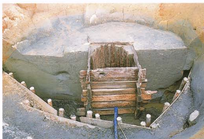
【 しばやま 芝山遺跡】 城陽市富野上ノ芝

5か年の計画的な発掘調査の最終年度で掘立柱建物跡や柵・溝などがみつかりました。塀と溝は寺域の北東角にあたり、これによって寺の東西の幅は約93mと判明しました。寺に関連する遺構や遺物の分布範囲からみると、南北の規模も90m前後と考えてよいようです。多量の瓦とともに出土した三彩の壺は ぶつき 仏器の優品です。