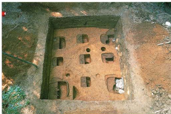
【 うちざとはつちよう 内里八丁遺跡】 八幡市内里日向堂