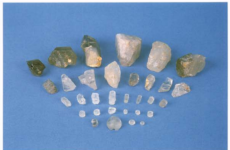
水晶製玉類の製作工程