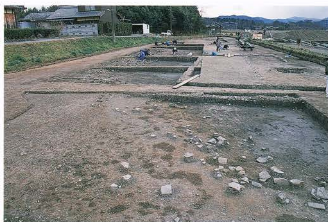
みっかいち 【三日市遺跡】 亀岡市馬路町