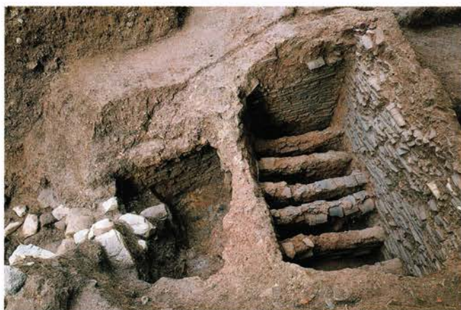
へいあんきょう 【平安京左京三条四坊十町】 京都市中京区

平安京に瓦を供給していた官営の瓦工房「小野瓦屋」の窯跡が崇道神社の御旅所で見つかりました。窯跡は残りがよく、瓦を焼く焼成室 しょうせいしつ と燃焼室 ねんしょうしつ からなり、ロストル(火道)をもつ平窯であることがわかりました。御旅所のある丘は、「おかいらの森」と呼ばれていますが、これはお瓦の森がなまったものとされています。