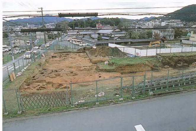
たかなし 【高梨遺跡】 北桑田郡京北町周山中山

福知山城の立地する丘陵には、弥生時代の集落遺跡が存在することが、これまでの城の周辺の発掘調査によってわかってきました。国道の拡張工事ともなう昨年度の調査では、弥生時代の竪穴式住居跡や平安時代の土坑がみつかっています。出土した平安時代の緑釉陶器の大型碗は、京都北部ではめずらしいものです。