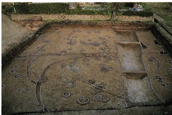
いさ 【石原遺跡】 福知山市石原