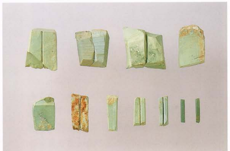
碧玉・緑色凝灰岩製の玉作り関連遺物

では、奈具岡遺跡の玉はどこに運ばれたのでしょうか。現在のところ、水晶製の玉は、丹後地域の弥生時代の遺跡からはほとんど出土していません。玉の行方は、なぞとして残されています。