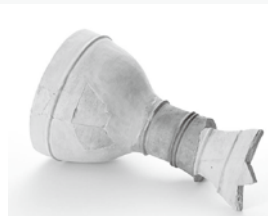
馬場南遺跡出土の陶製鼓胴