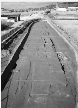
見つかった直線溝

この木簡の出土により、この地に役所や貴族の邸宅などの施設があった可能性が考えられます。