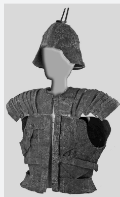
私市丸山古墳出土の甲冑

古墳は、国指定史跡となり、綾部市の努力により築造当時の姿に復元・整備され、公園として活用されています。