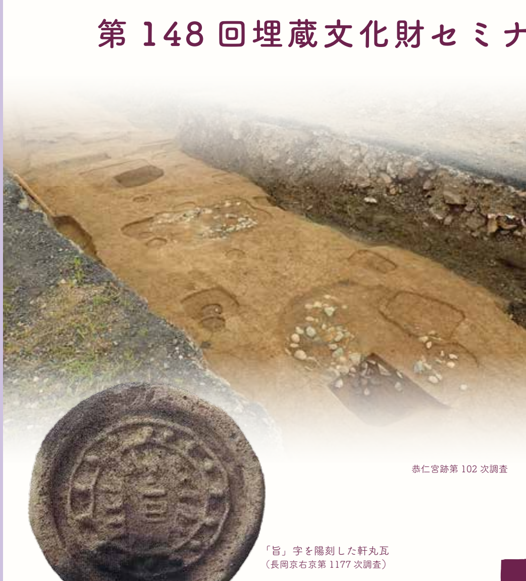
恭仁宮跡第102次調査