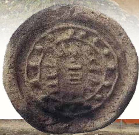
「旨」字を陽刻した軒丸瓦 (長岡京右京第1177次調査)