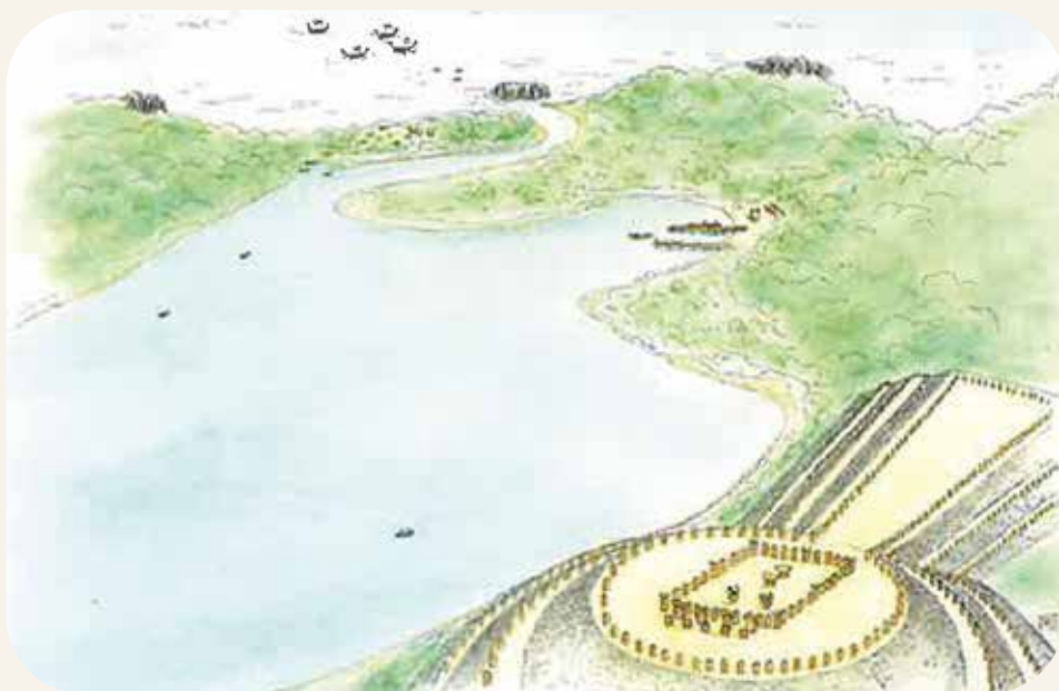
築造当時の神明山古墳の様子 早川和子 画