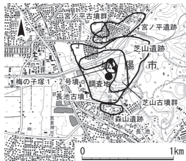
第1図 調査地位置図および周辺遺跡分布図(1/25,000 宇治)

今回の調査では、飛鳥時代の土坑や奈良時代の掘立柱建物、柵、溝、土坑などを検出しました。 掘立柱建物 7棟を復元することができました。建物の方位により大きく2群に分けること