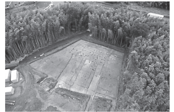
写真2 調査地全景（東側上空から）