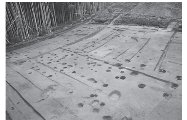
写真3 調査地全景（南から）