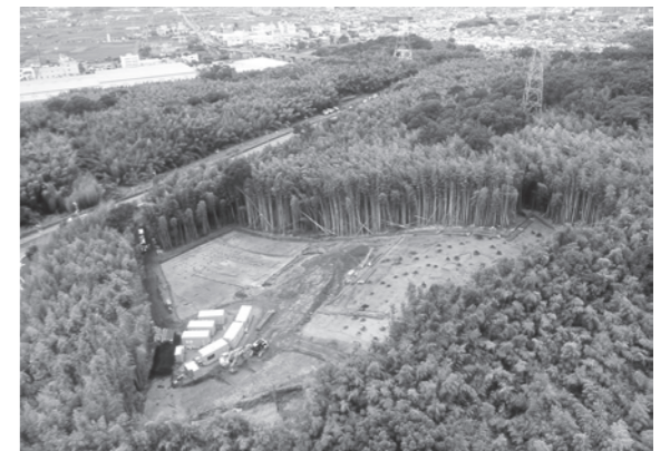
写真1 調査地全景（南東上空から）